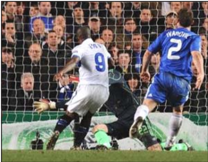
Samuel Eto'o Fils marque le but victorieux d'Inter de Milan face à Chelsea.

Pour les Africains, Chelsea-Inter de Milan était un peu particulier, en ce qu'il mettait aux prises deux de ses dignes représentants dans la ligue des champions. Il s'agit de l'Ivoirien Didier Drogba, le récent Ballon d'Or africain, et le Camerounais Samuel Eto'o Fils, son dauphin au classement de la Caf. Et ils étaient encore nombreux, à Brazzaville, dans les salles de vidéo et dans leurs salons, scotchés dans