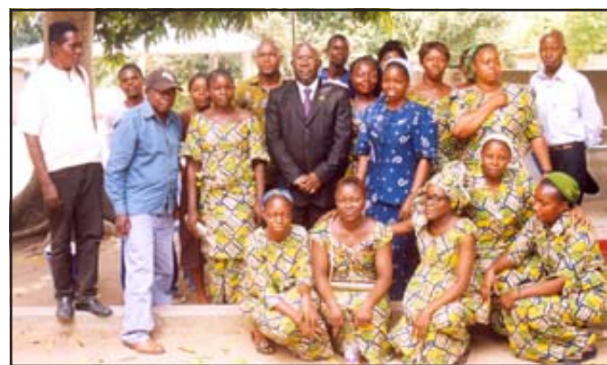
L'honorable Prosper Diatoulou entouré du personnel du complexe.

C'était sous le même thème que celui de la D.d.e.c (Direction diocésaine de l'éducation catholique): «Le rôle et les devoirs de la femme dans l'éducation