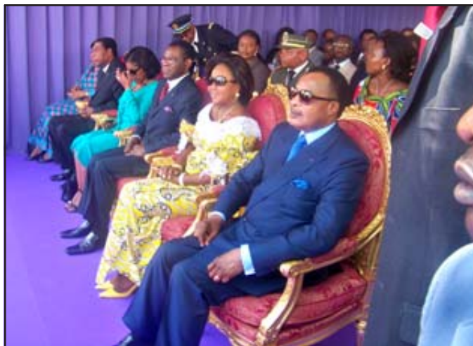
Le président Sassou Nguesso, son épouse Antoinette et les deux autres couples présidentiels.

a été la première présidente de l'O.p.d.a.s (Organisation des premières dames d'Afrique contre le sida), de 2002 à 2004. Organisation dont elle a participé à la création, en juillet 2002, à Genève (Suisse), et dont elle a, par la suite, dirigé l'antenne du Gabon dont les principales missions consistent à mobiliser des fonds en faveur des femmes et des enfants victimes du sida. Pour cette cause, elle ne manquait pas de mobiliser les épouses des chefs d'Etat du continent. Membre de l'O.n.g Médecins du monde dont elle présidait l'antenne du Gabon, Edith Lucie Bongo Ondimba était, également, présidente d'honneur de la Société gabonaise de pédiatrie et de la Société française de médecine. Elle a reçu la médaille de reconnaissance des laboratoires Mérieux, le 31 mai 1996, à Libreville et celle de la légion d'honneur françai-