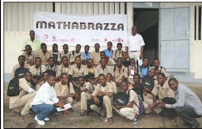
Quelques participants au concours.

Le 2 ème rallye Mathabrazza (un concours de mathématiques) s'est déroulé, jeudi 11 mars 2010. Ce concours a rassemblé 400 élèves de 12 lycées de Brazzaville, de Kinshasa et de Pointe-Noire. Depuis deux ans, à l'initiative du lycée Saint Exupéry, le rallye