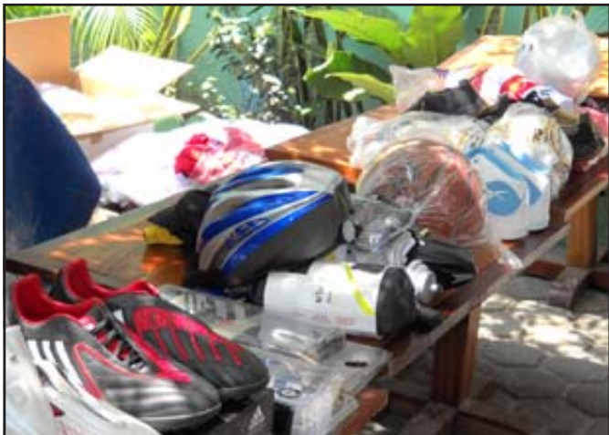
Un échantillon des équipements sportifs remis aux sections du club.

l'érection du mur d'enceinte, vont reprendre normalement en juin. Par ailleurs, toutes les sections sportives du club (football, cyclisme, basket-ball, volley-ball, handball) ont reçu une dotation en équipements sportifs. La cérémonie de réception de ce matériel, a eu