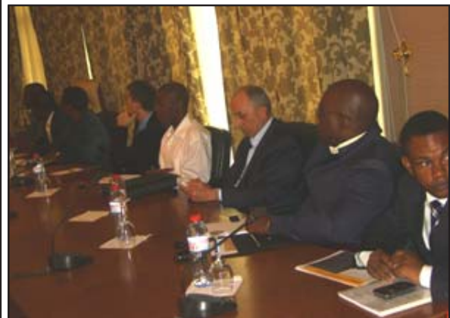
Une vue des responsables des sociétés de téléphonie mobile.

Une rencontre entre l'Agence de régulation des postes et télécommunications et les sociétés de téléphonie mobile, opérant au Congo (Zain, M.t.n, Warid, Congo-Télécom et le groupe Bintel représenté par Equateur Télécom) a eu lieu, mercredi 17 mars 2010, à l'hôtel Résidence Marina, à Brazzaville. Cette rencontre a eu pour but d'informer et édifier les compagnies de téléphonie mobile sur l'environnement juridique et institutionnel du secteur et sur les priorités et les orientations de l'agence de régulation.