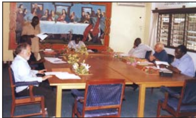
Une vue des évêques et ordinaires du Congo.

6. Vous savez qu'un énorme tremblement de terre de magnitude 7 a frappé Haïti, près de la capitale Port-au-Prince, mardi 12 janvier 2010, provo-