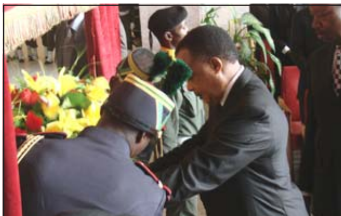
Le président Denis Sassou Nguesso s'inclinant devant la dépouille de l'illustre disparu.