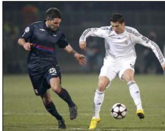
Cristiano Ronaldo (maillot blanc) impuissant face à Lyon.

Les Congolais se passionnent pour la Ligue européenne des champions. Certains font même des paris. Mardi 16 février 2010, nombreux ont suivi, avec intérêt, un certain Lyon-Real Madrid, l'un des huitièmes de finale aller de cette compétition. Les supporters de Madrid sont déçus, contrairement à ceux de Lyon, qui jubilent. Oui! En battant Madrid, par 1-0, l'Olympique lyonnais a déjoué les pronostics, même si le match a eu lieu à domicile. Car il n'est pas donné à n'importe qui de plier une équipe de Real constellée de vedettes, les plus célèbres étant le Portugais Cristiano Ronaldo et le Brésilien Kaka. Le but victorieux inscrit par Jean Il Makoun pourrait permettre à Lyon de se qualifier, le 10 mars prochain, au Stade Santiago-Bernabeu de Madrid. A condition que Lyon soit aussi rigoureux que mardi soir, dans son antre de Gerland. Autres résultats: Milan A.C (Italie)-Manchester United (Angleterre):2-3 F.C Porto (Portugal)-Arsenal (Angleterre): 2-1 Bayern Munich (Allemagne)-Fiorentina (Italie): 2-1